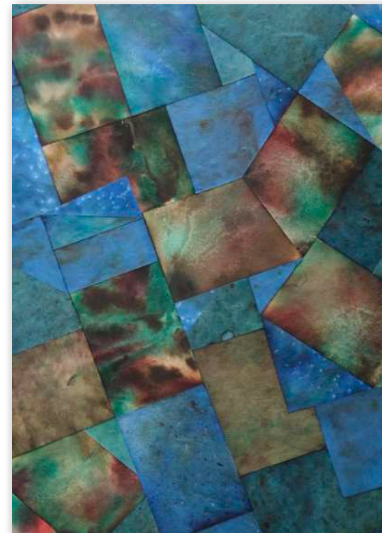
土佐和紙にインクを滲ませたコラージュ作品写真（A2） ※白い斑点模様のテクスチャは瀬戸内海の塩による効果