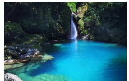
仁淀ブルーの聖地 ニコ淵

この特別な町であなたも壮大で美しい自然と和紙の歴史に触れ、 時空を超えた旅を試みませんか、